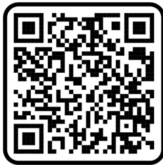
รายละเอียดตัวชี้วัดรอบ ๒

๓. ดำเนินการถ่ายทอดตัวชี้วัดและค่าเป้าหมายการประเมินผลฯ ไปสู่ระดับบุคคล พร้อม จัดทำบหน้าตัวชี้วัดการประเมินผลฯ ตำแหน่งพัฒนากร ส่งให้สำนักงานพัฒนาชุมชนจังหวัดในรูปแบบไฟล์ Portable Document Format (PDF) ภายในวันศุกร์ที่ ๕ มิถุนายน ๒๕๖๙ (หนังสือราชการแจ้งผ่านระบบ E-Office แล้ว)